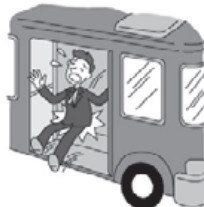
バスのステップを踏みはずしケガをした。