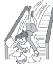
階段で転倒しケガをした。