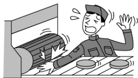
機械にまきこまれケガをした