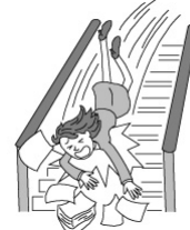
階段で転倒しケガをした