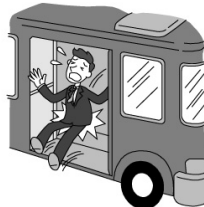
バスのステップを踏みはずしケガをした