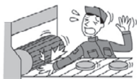
機械にまきこまれケガをした。