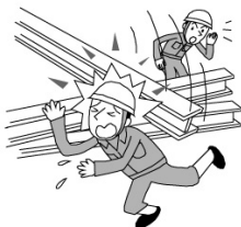
資材が倒れケガをした