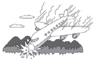
出張中、旅客機がつい落し死亡した。