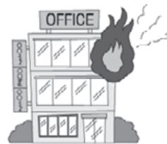
火災にあいケガをした。