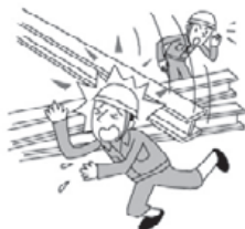
資材が倒れケガをした。