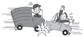
車が衝突しケガをした。