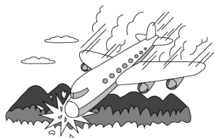
出張中、旅客機がつい落し死亡した