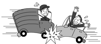
車が衝突しケガをした