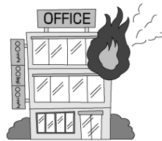
火災にあいケガをした