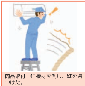
商品取付中に機材を倒し、壁を傷つけた。