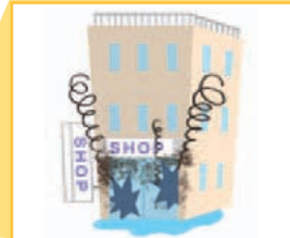
テナントとして入居した店が火災で焼失した。(建物所有者への賠償)