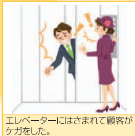
エレベーターにはさまれて顧客がケガをした。