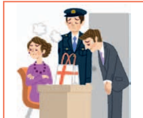
店員が間違えて警察に通報し、顧客が取り調べをうけてしまった。

※人格権侵害に関するお支払いについては、1被害者につき100万円、1事故・保険期間中につき1,000万円がお支払い限度額となります。