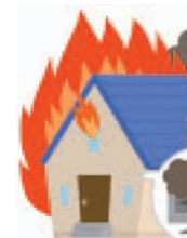
家電製品より出火しました。