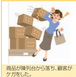
商品が陳列台から落ち、顧客がケガをした。