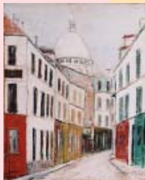
ユトリロ 《サン・リュスティック通りとサクレ=クール教会堂》 1918年頃

© Jean Fabris, 2002 © ADAGP, Paris & IJACS, Tokyo, 2002