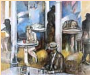
和田義彦 《想》 2001年