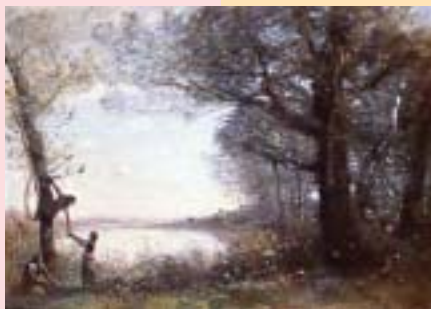
コロー 《鳥の巣を捕る子供たち》 1872年~1873年頃