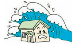
③津波により建物が流された