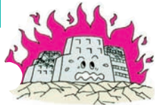
①地震で火災が発生し建物が焼けた