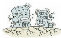
②地震で建物が倒壊した