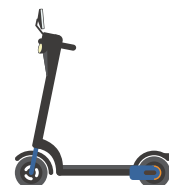
特定小型原動機付自転車のイメージ図