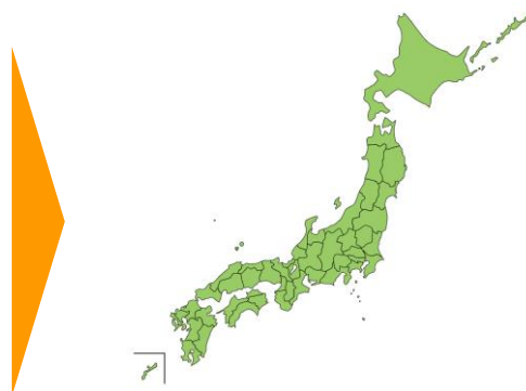
2025年11月時点（47都道府県）