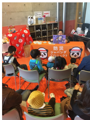
導入紙芝居の様子