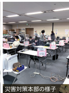
災害対策本部の様子