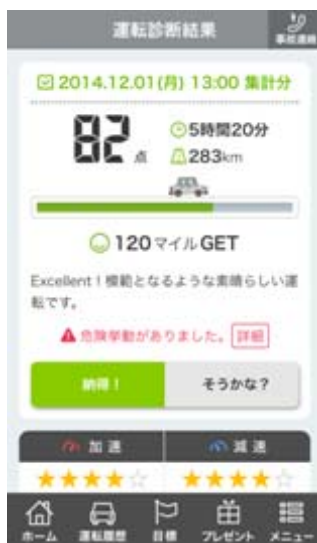
<安全運転診断結果>