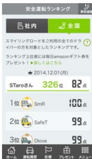
<安全運転ランキング>