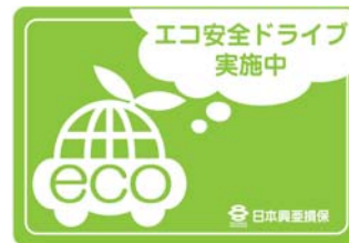
『エコ安全ドライブステッカー』 (車外貼付用)